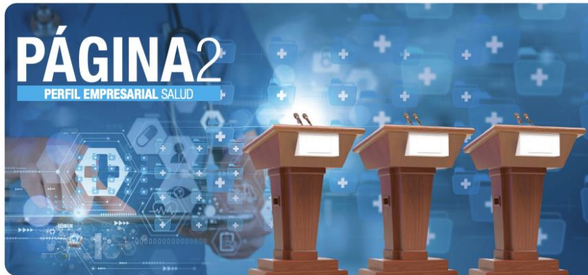
La Cámara Costarricense de la Salud espera que las propuestas sirvan de base para una agenda sanitaria de largo plazo que trascienda los gobiernos de turno.